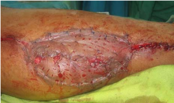
Gambar 3 Foto Intra Operatif

Dari durante operasi Bedah Onkologi ditemukan massa tumor mulai dari angulus mandibular kiri sampai angulus mandibular kanan, batas tegas, berisi cairan jernih bersepta-septa, dinding tipis dan rapuh, dilakukan segmental mandibulektomi.