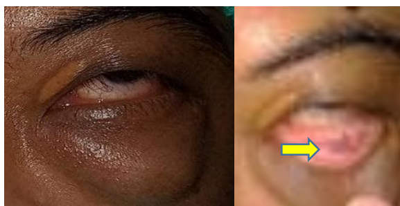
Gambar 1. Foto klinis sebelum operasi

Proptosis non-aksial, dengan ditemukan massa ukuran 4 x 2 cm yang memiliki batas tegas, tidak sakit saat ditekan, terfiksir, dan memiliki warna yang serupa dengan kulit pada kelopak mata bawah mata kiri yang ditunjukkan dengan foto klinis sebelum operasi (gambar 1). Selain itu, di konjungtiva tarsal di kelopak mata bawah terlihat warna kebiruan (gambar 1 panah kuning).