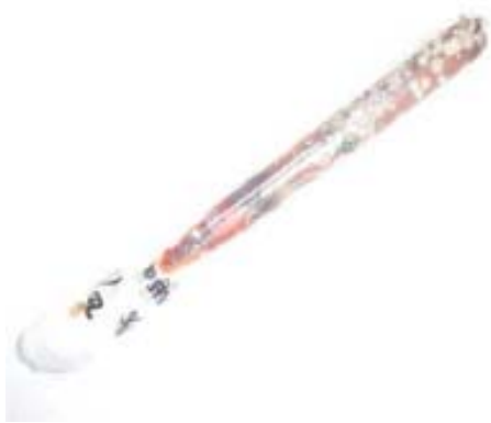
Gambar 1. Kultur darah positif, tampak koloni Candida pada medium SDA

Tabel 3 menunjukkan bahwa 28 dari 34 (20%) sampel yang positif kultur Candida juga positif pada giemsa. Hal ini ditandai dengan tampaknya elemen jamur Candida berupa sel ragi dan pseudohifa.