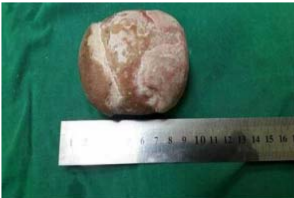
Gambar 2. Ukuran batu buli (hasil operasi)